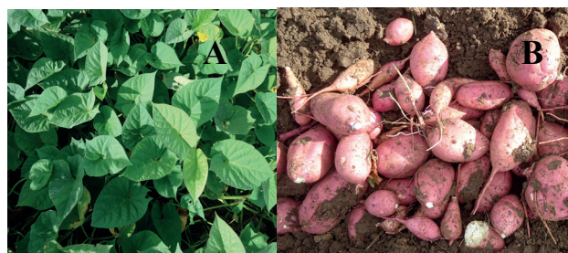
(A) Follaje y (B) raíces tuberosas

Color predominante de la piel de la raíz tuberosa: rojo. Color predominante de la masa de la raíz tuberosa: amarillo oscuro Masa seca: 24,1 % Índice de afectación por tetuán ( Cylas formicarius F.): bajo (<4,6 %) Ciclo de cosecha: 110-120 días. Rendimiento potencial: 58 t ha -1