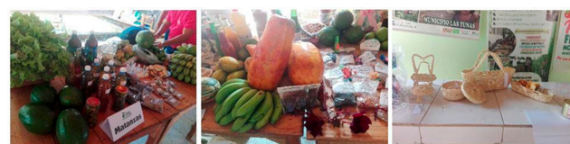
Figura 2. Mujeres y hombres participan en Festival Nacional de Innovación PIAL, 2019.

La diversificación de la actividad económica familiar (Tabla 2), ha sido otro resultado a destacar. Las entrevistas a ocho familias del municipio San José de las Lajas, provincia Mayabeque, muestran cambios en este sentido. Entre las nuevas actividades realizadas por las familias se encuentran: la conservación de alimentos, la producción de vinagres, de plantas ornamentales, la cría de conejos, la elaboración de arreglos florales, la producción de condimentos secos; actividades aprendidas por las mujeres y los hombres en los GIALs y por los niños/as en los círculos de interés (12). No obstante, existen un grupo de labores y actividades agrícolas en las cuales la incorporación de la mujer es mayoritaria, pero en la mayoría su participación es aún limitada, lo cual se debe a varios factores como: tradición, peso de las labores domésticas, subestimación, entre otras (13).