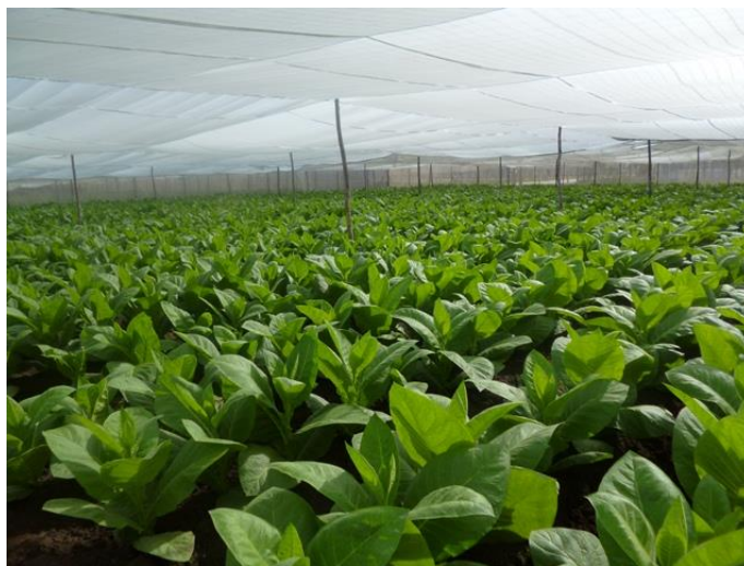
Figura 1. Tobaco ‘Corojo 2012’