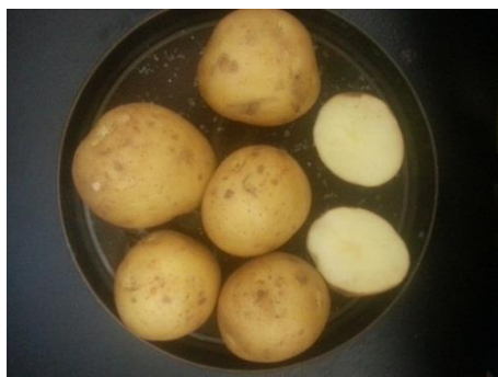
Figura 2. Nuevo cv. "Tula": forma y colores del tubérculo

Datos característicos del cultivar fueron recolectados durante 2014-2016. Hábito de crecimiento: erecto; tallos: verdes; altura media: 0,50-0,60 m; hojas: verde medio; color de la flor: violeta; período vegetativo: medio-temprano (90 días); resistente a la infección foliar por Phytophthora infestans (grado 3); Streptomyces scabies : resistencia media (grado 2); forma de tubérculo (Figura 2): redonda; color de piel: amarillo; color de carne: amarillo pálido; ojos: profundidad intermedia; materia seca: alta (19-20 %) y rendimiento potencial: 35 t ha -1 .