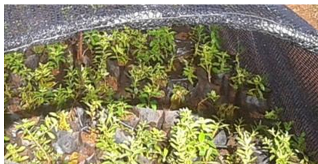
Figura 1. Esquejes enraizados de Stevia rebaudiana Bertoni sembrados en el vivero de la Empresa Agroindustrial Ceballos.

Como material vegetal se utilizaron esquejes (brotes con una longitud de aproximadamente 8-10 cm), procedentes de plantas madre de Stevia rebaudiana Bertoni propagadas in vitro , con 120 días después de la siembra mantenidas en el Área de Adaptación del Centro de Bioplasmas de Ciego de Ávila y libre de plagas (Figura 1). Fueron previamente cultivadas en bolsas de polietileno de 1,2 L de capacidad, que contenían como sustrato una mezcla de suelo Ferralítico Rojo Compactado y cachaza (1:1 v/v) (15).