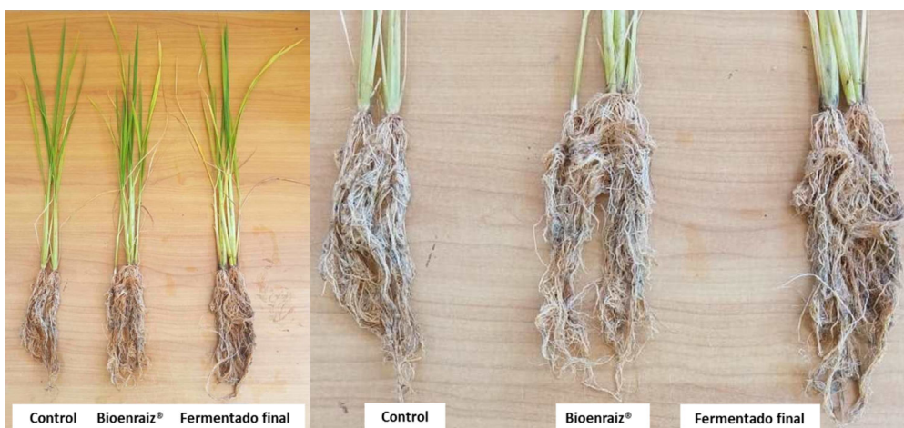
Figura 2. Efecto de la inoculación de Bioenraiz® y el producto final de la fermentación en el volumen o masa de plantas de arroz cultivar Selección 1, a los 60 días de la siembra, en condiciones semicontroladas

fundamentalmente ácido indol acético (AIA), que constituye su principal ingrediente activo. Este ácido se libera al medio durante la fermentación de la cepa Rhizobium sp. (14). La fitoestimulación, a partir de la producción de compuestos indólicos como el AIA, es reconocida como uno de los mecanismos más importantes que emplean los rizobios para promover el crecimiento de las gramíneas (16). Esto explicaría el efecto bioestimulador de Bioenraiz® y del producto final de la fermentación al incrementar la masa seca de raíz. Plantas con un sistema radical más desarrollado pueden explorar una superficie de suelo más extensa y absorber mayor contenido de nutrientes.