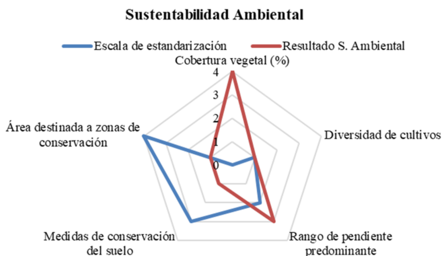
Figura 1. Multivariable sustentabilidad ambiental

El análisis social en las fincas cacaoteras del recinto Cañales evidenció un nivel medio de sustentabilidad social (2,84 puntos). Predominan viviendas de cemento y una alta integración comunitaria, aunque existen limitaciones en el acceso a educación, salud y alcantarillado. Además, se identificó un bajo nivel de conocimiento en prácticas ambientales y agrícolas, lo que resalta la necesidad de fortalecer la capacitación y mejorar los servicios básicos para elevar el bienestar social (Figura 3).