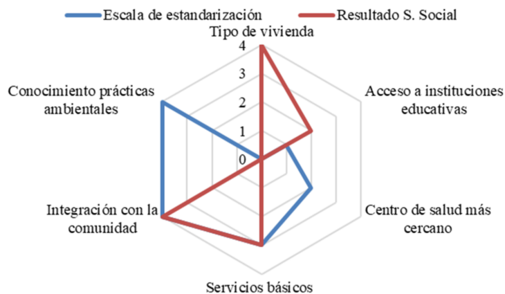
Figura 3. Multivariable sustentabilidad social