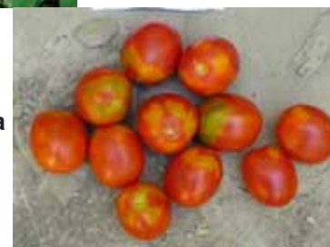
Figura 1. Frutos de la variedad Severino Corbarese

Estas características coinciden con las reportadas por otros autores para este genotipo en particular y otros susceptibles a esta fisiopatía (2, 3, 4, 5, 6, 7, 8, 12).