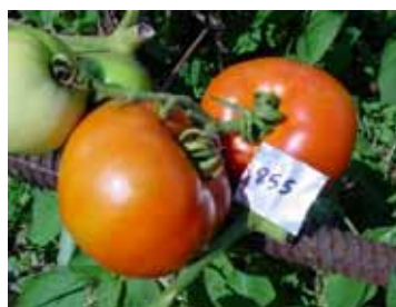
(A) afectados por mancha solar

El típico síntoma es un anillo de tejido alrededor de la cicatriz pedúncular (zona estilar del fruto) que toma un color amarillo (Figura 1). Esta manifestación de la mancha es llamada hombro amarillo (Yellow Shoulder), puede tener un rango de severidad desde solo unos pocos milímetros de ancho en una porción del hombro hasta la tercera parte del fruto, mientras que el resto del tomate presenta una coloración roja normal.