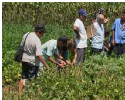
Foto 1. Los agricultores en las ferias seleccionan las mejores variedades

Existen algunos trabajos en la literatura que hacen ver el fitomejoramiento participativo y la experimentación campesina en Cuba como un modelo de investigación, para elevar las condiciones de vida de los pequeños agricultores mediante el aumento del rendimiento de las cosechas y, a la vez, la conservación y el enriquecimiento de la diversidad, como se muestra en la Foto 1 (3).