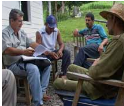
Foto 2. Intercambio entre investigadores y agricultores de La Palma, Pinar del Río